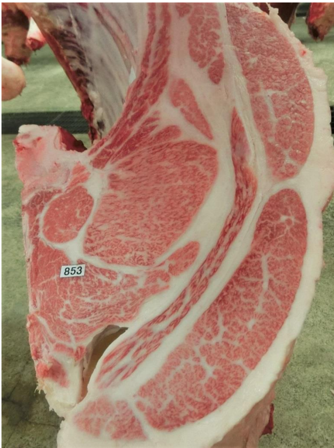
・ロースの断面 (左写真)