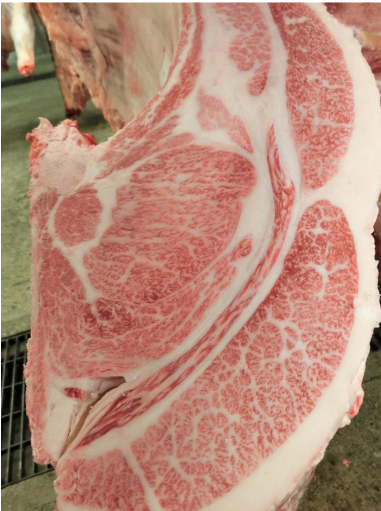
・ロースの断面 (左写真)