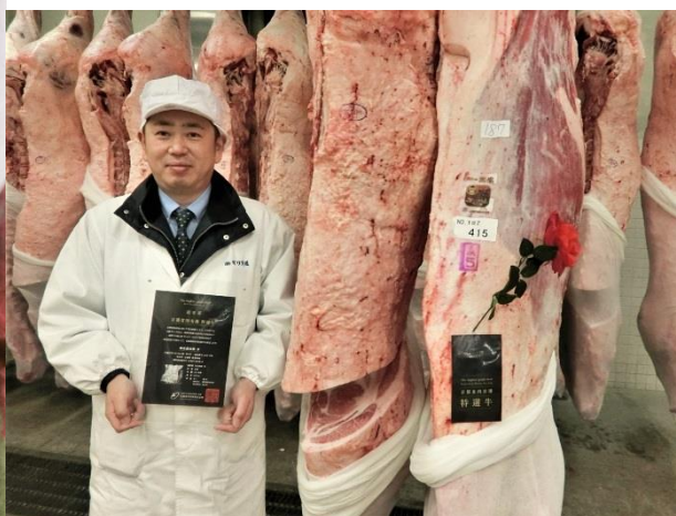
・(株)モリタ屋 大塚部長 (右写真)