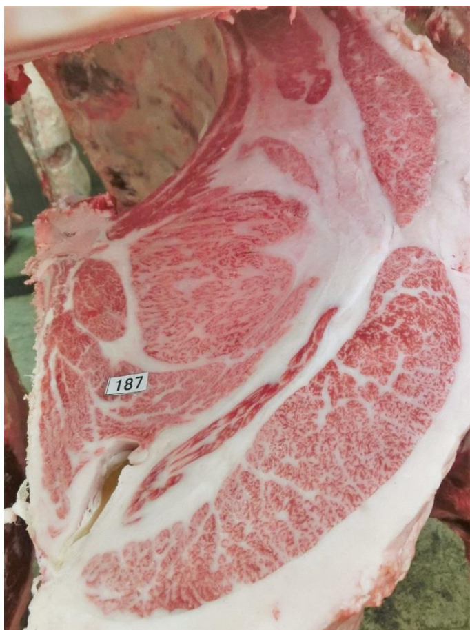
・ロースの断面 (左写真)