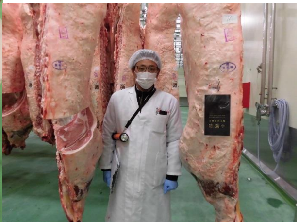
・ロースの断面 (左写真)